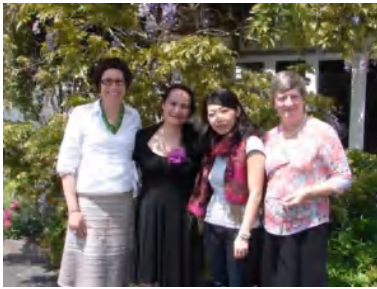
RELAのスタッフはみんなフレンドリー