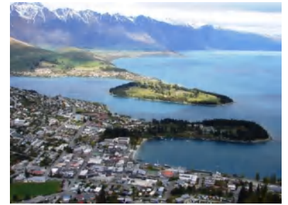
クイーンズタウンは自然がいっぱい！