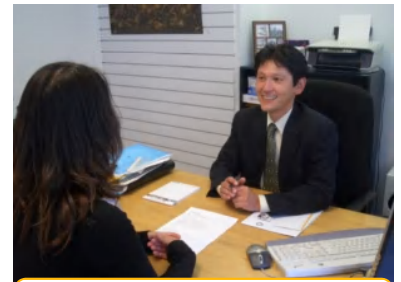
現地オフィスは頼れる存在

日本人スタッフによる空港出迎え 到着後オリエンテーション 現地情報の提供、情報誌や地図の配付 交通手段の説明 携帯電話の案内 24時間緊急サポート 病気や事故時のサポート 銀行口座開設のご案内 荷物の一時預かり(貴重品は除く) 現地生活の情報提供やカウンセリング 私書箱サービス 英文履歴書作成のサポート 仕事や部屋の探し方のアドバイス IRDナンバー取得の案内 各種学校の情報提供やカウンセリング 入学手続きの代行 旅行の情報提供、格安旅行代理店の紹介 求人やフラットの募集サイトの案内 日本語環境のパソコンの利用