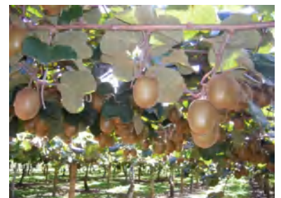
日本ではできない経験に チャレンジしよう！