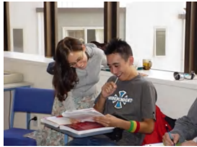
日本人の割合が低いLSI