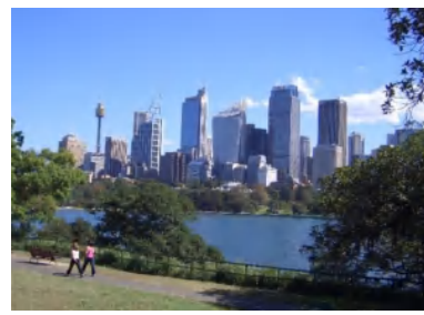
いろんな顔を持つ大都市シドニー