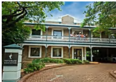
環境の整った学校インフォーラム