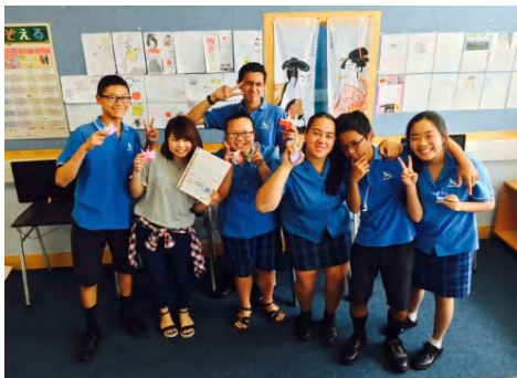
日本語教師にチャレンジ！

アルバイトができるので滞在費を稼ぎながら少ない予算で海外生活を送ることができます。